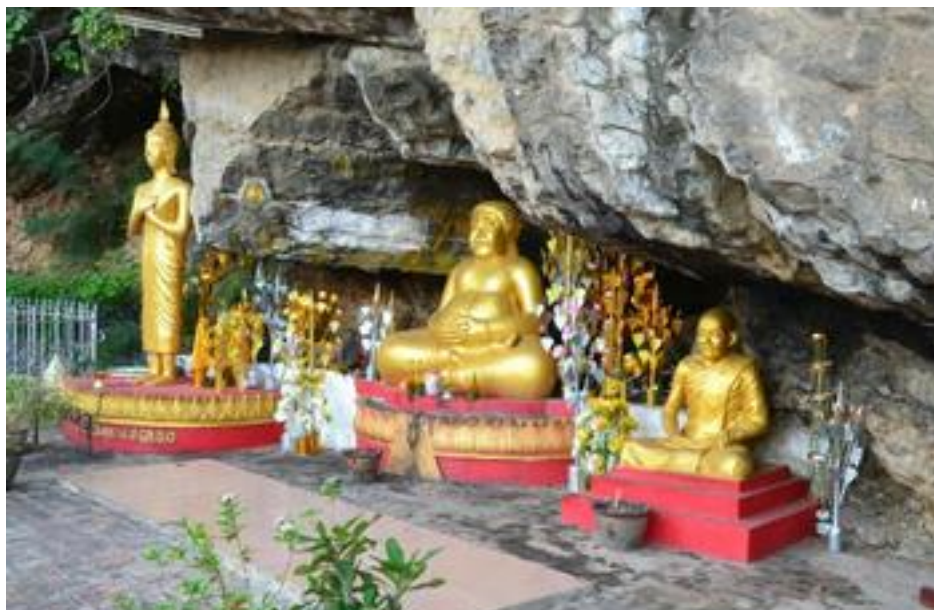
00.02: Вадделов Вигиттхонг. Отдых на южном побережье Паттайя