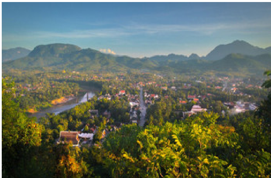
Фотообзор отеля для проведения тренинга в Лаосе